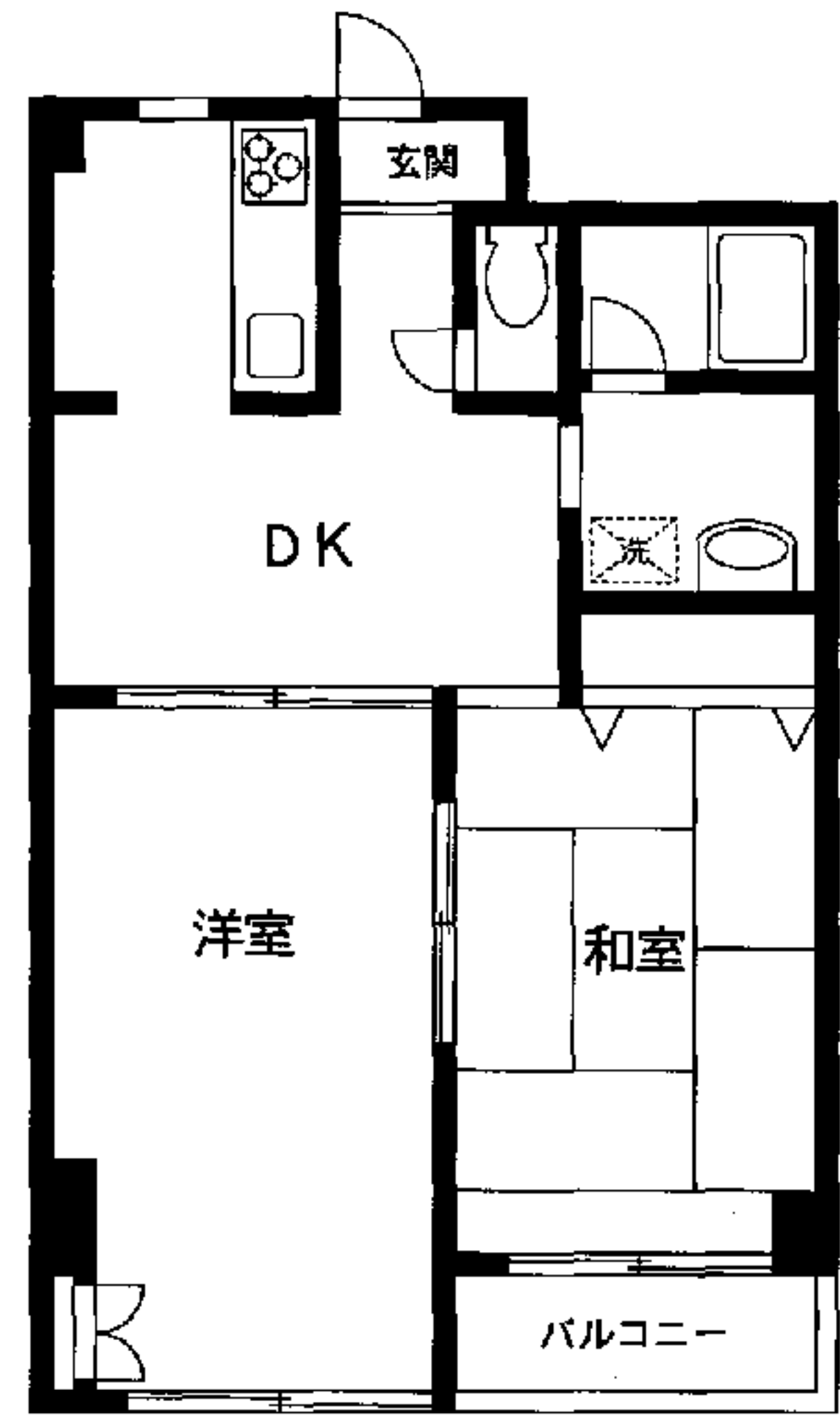
202号室 ※203号室は反転タイプになります。